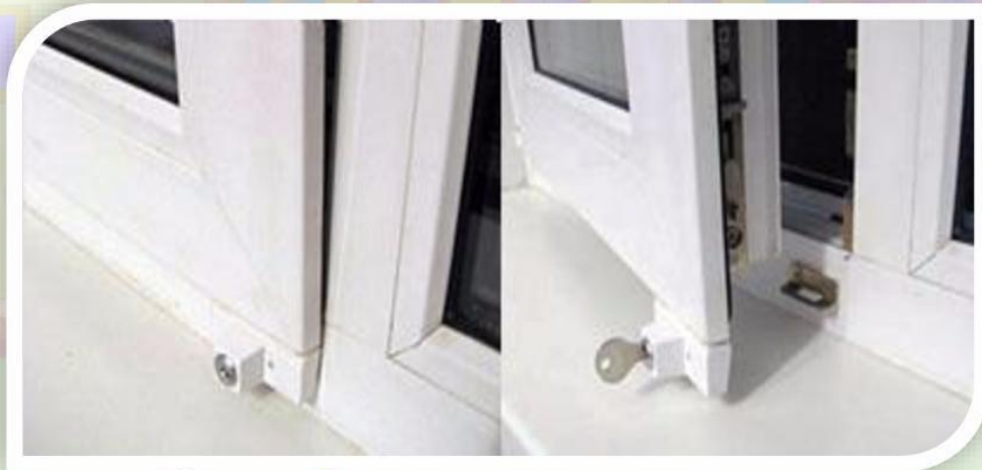
Замок блокировщик с ключом

Можно воспользоваться специальными замками блокираторами, которые предлагают установщики пластиковых окон.