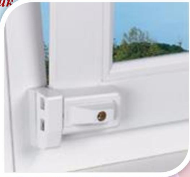
Блокировщик с кнопкой